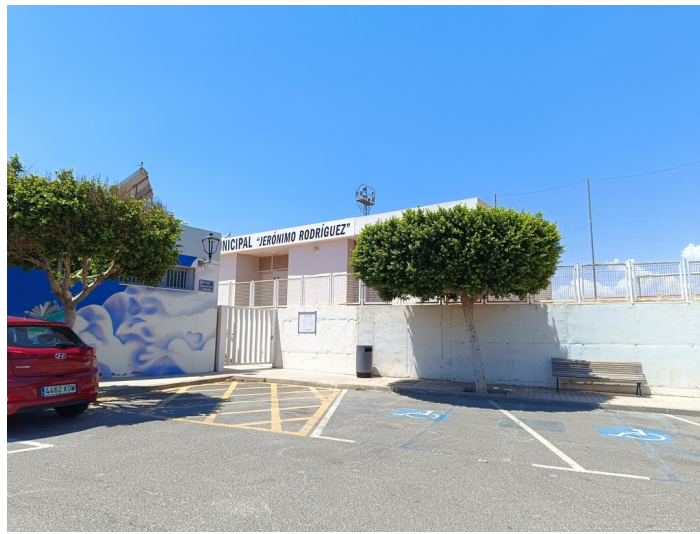
Terrenos del Campo Municipal de futbol Jerónimo Rodríguez / Pistas de Pádel