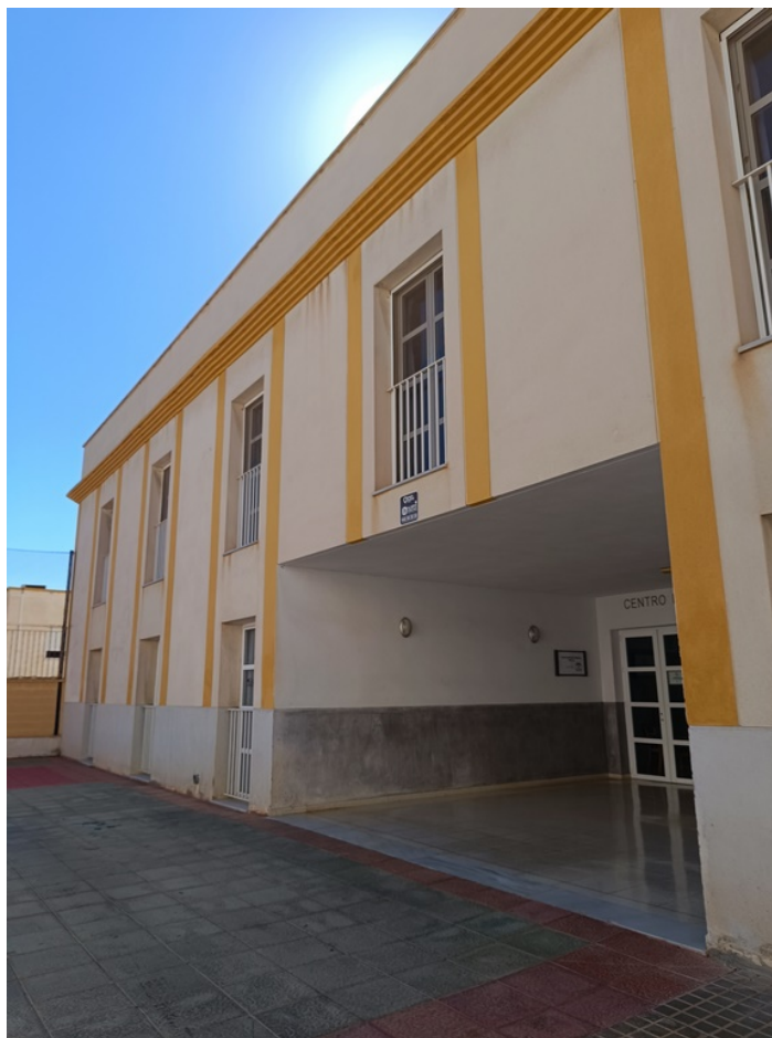
U.E.D. Minerva y Centro de Día