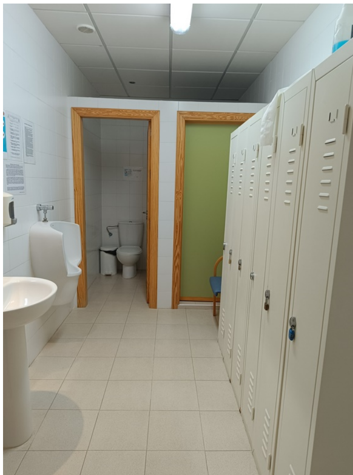
U.E.D. Minerva y Centro de Día