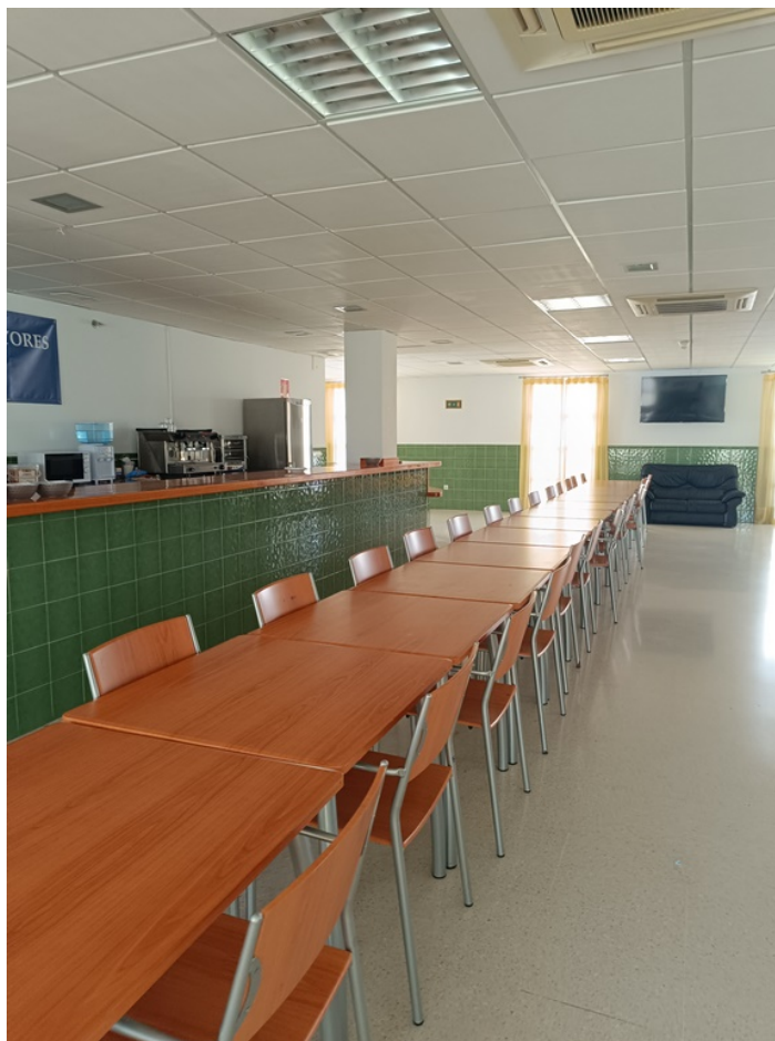
U.E.D. Minerva y Centro de Día