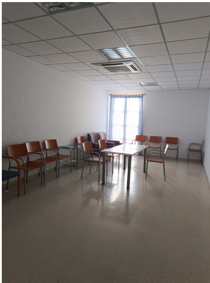
U.E.D. Minerva y Centro de Día