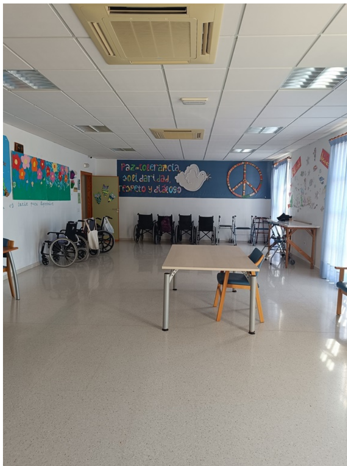
U.E.D. Minerva y Centro de Día