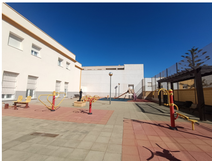
U.E.D. Minerva y Centro de Día