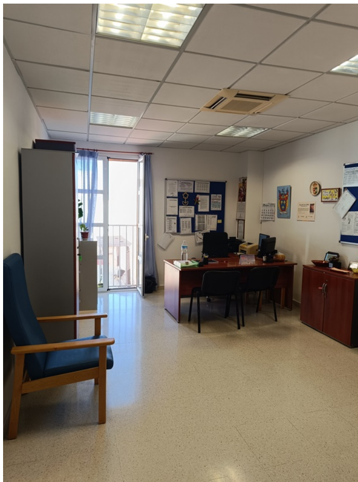
U.E.D. Minerva y Centro de Día