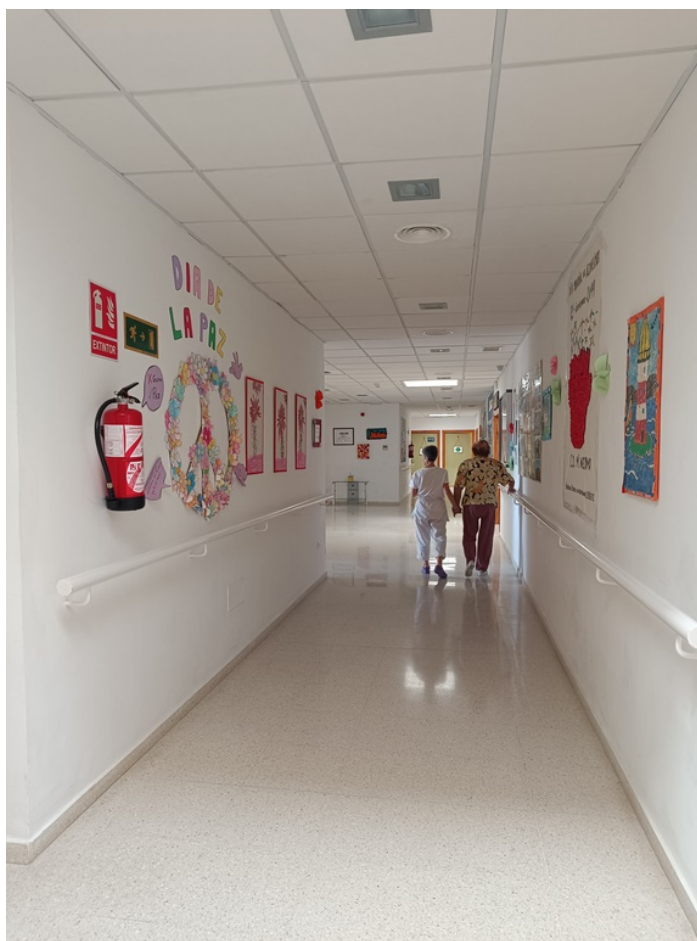
U.E.D. Minerva y Centro de Día