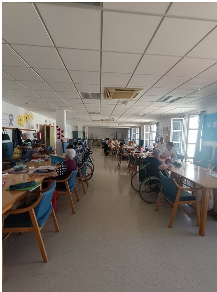
U.E.D. Minerva y Centro de Día