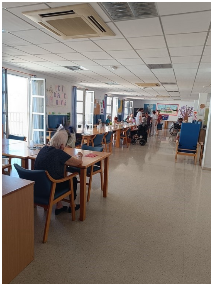
U.E.D. Minerva y Centro de Día