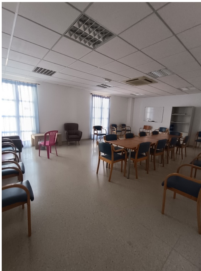
U.E.D. Minerva y Centro de Día