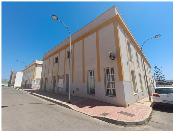
U.E.D. Minerva y Centro de Día