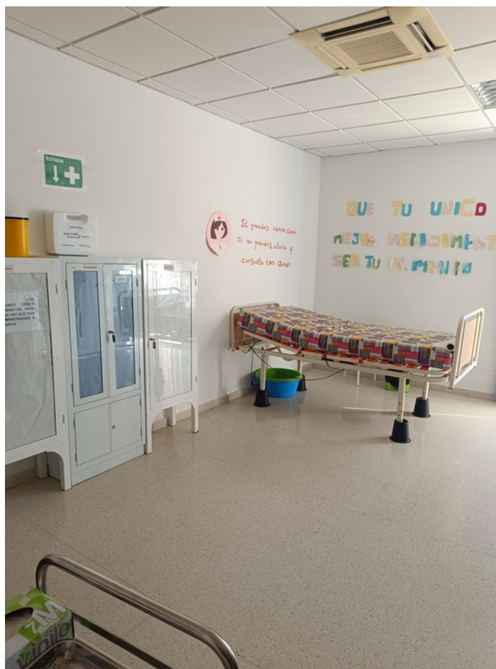
U.E.D. Minerva y Centro de Día