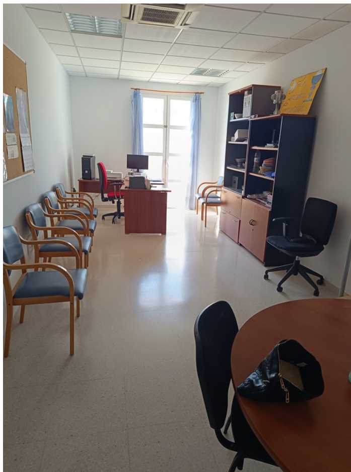
U.E.D. Minerva y Centro de Día