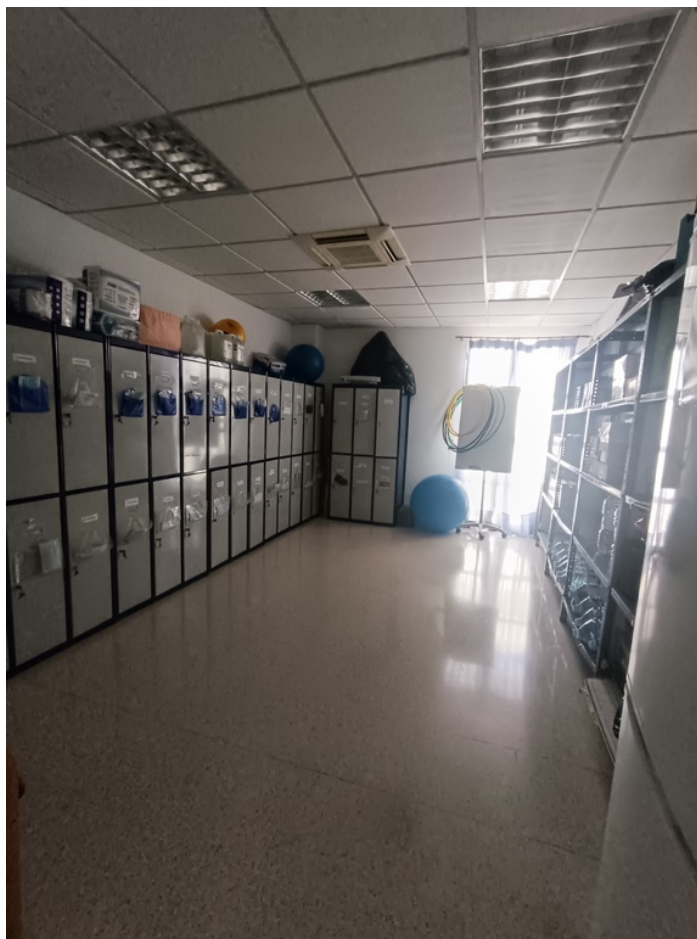
U.E.D. Minerva y Centro de Día