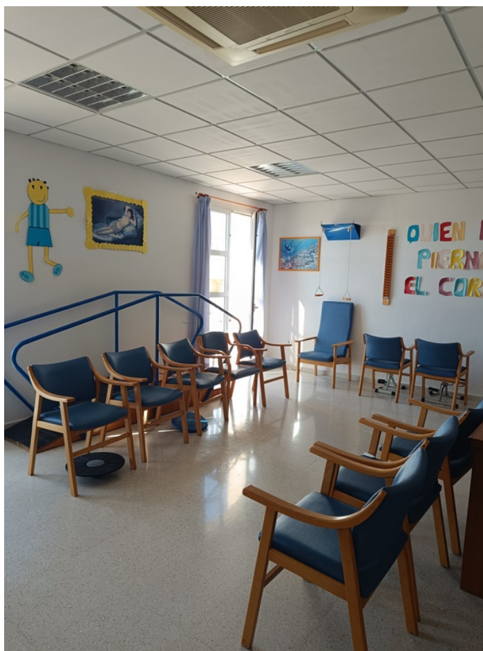
U.E.D. Minerva y Centro de Día