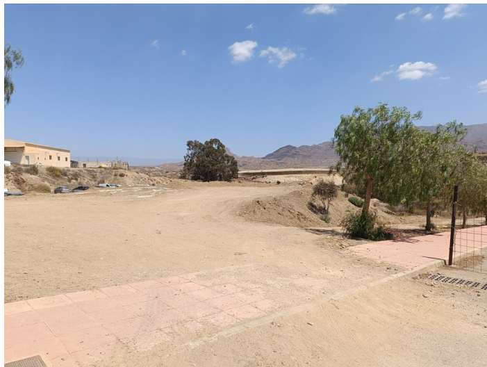
Solar-parcela Doc (ua-6)