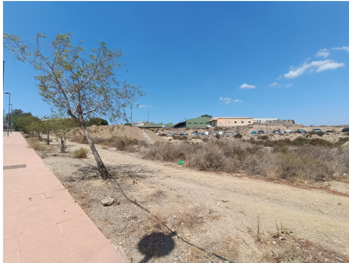
Solar-parcela Doc (ua-6)